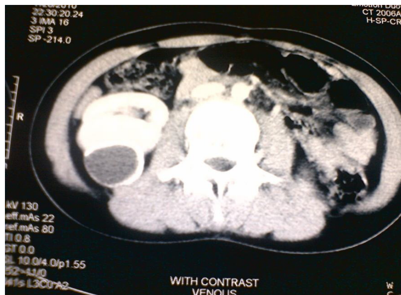
تصویر ۱: سی تی اسکن کیست هیداتید با لایه‌های داخلی و خارجی کیست در کلیه راست بیمار قبل از عمل جراحی